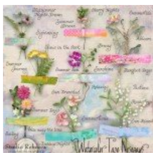
Cewe Fotókönyv heti kihívás 263. győztese