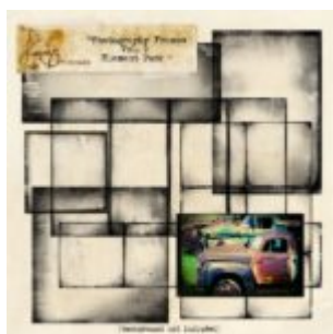
Cewe Fotókönyv heti kihívás 282. győztese