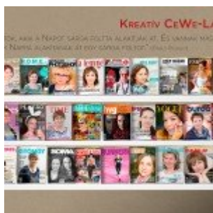
A mi tablónk