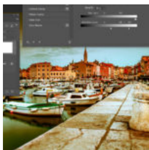
Photoshop - Gradient