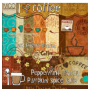
Cewe heti kihívás 92. győztese