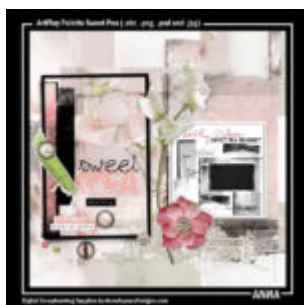
Cewe Fotókönyv heti kihívás 164. győztese