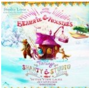
Cewe Fotókönyv heti kihívás 255. győztese