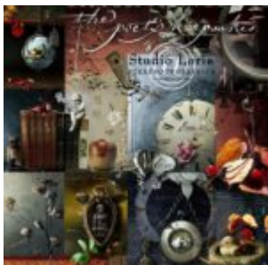
Cewe heti kihívás 70. győztese