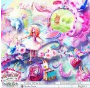
Cewe Fotókönyv heti kihívás 356. győztese