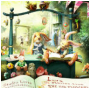
Cewe Fotókönyv heti kihívás 151. győztese