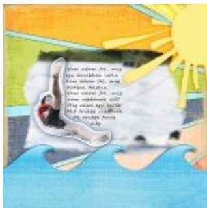
Csak egy ötlet