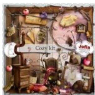
Cewe heti kihívás 25. győztese