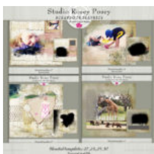
Cewe heti kihívás 107. győztese