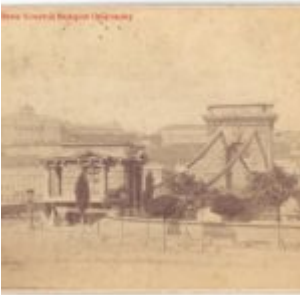
Nedves kollódiumos eljárás