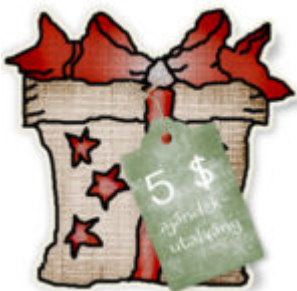
Cewe heti kihívás 16.