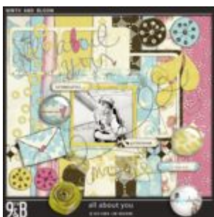
Cewe heti kihívás 72. győztese