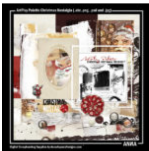
Cewe Fotókönyv heti kihívás 185. győztese