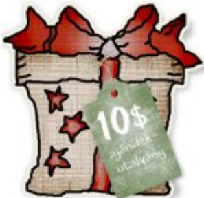
Cewe Fotókönyv heti kihívás 370.