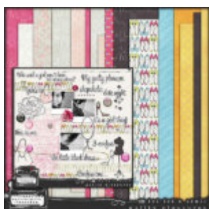
Cewe heti kihívás 97. győztese