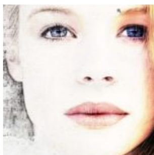
Már megint festegetünk