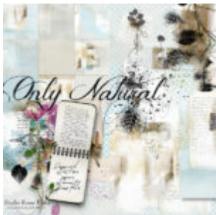
Cewe Fotókönyv heti kihívás 283. győztese