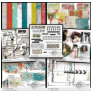
Cewe Fotókönyv heti kihívás 293. győztese