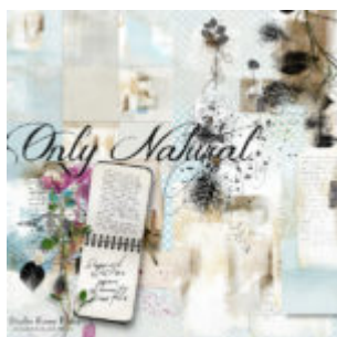
Cewe Fotókönyv heti kihívás 283. győztese