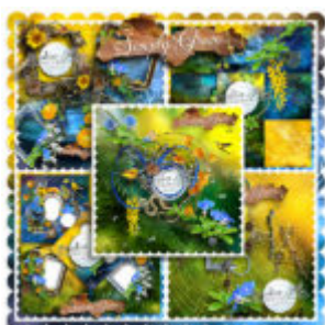
Cewe Fotókönyv heti kihívás 222. győztese