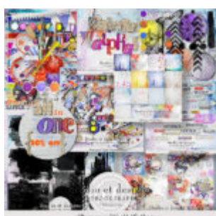
Cewe Fotókönyv heti kihívás 297. győztese