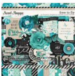
Cewe Fotókönyv heti kihívás 370. győztese