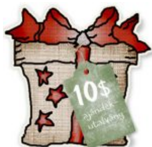
Cewe Fotókönyv heti kihívás 370.