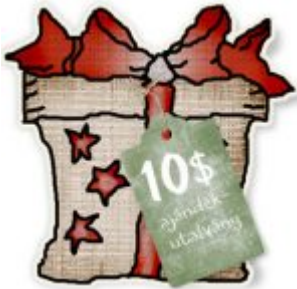
Cewe Fotókönyv heti kihívás 370.