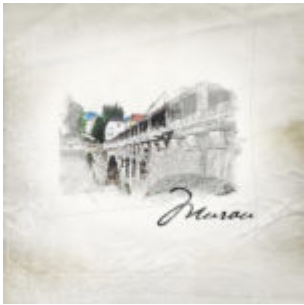
Kiegészítő pluginok - PostworkShop