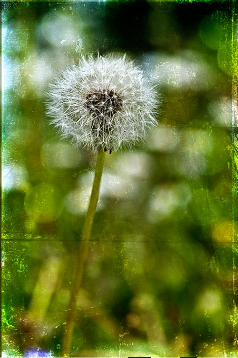
Before pitypang After