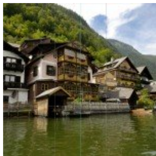
Mozaik kép készítése Photoshop-ban