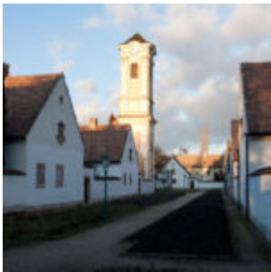
Shadow/Highlight avagy árnyék/csúcsfény