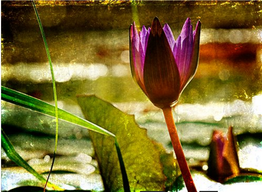
Before tavi liliom After