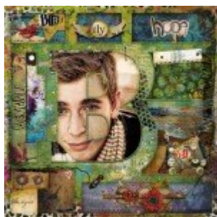
Réteg stílus tipp