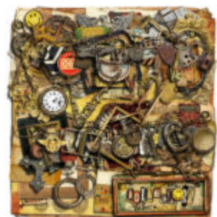
Cewe heti kihívás 31. győztese