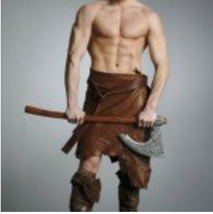
Hard Light Effect