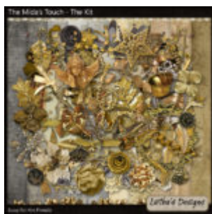
Cewe Fotókönyv heti kihívás 294. győztese