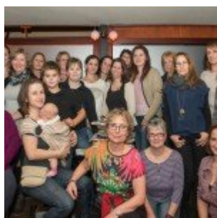
8. CEWE találkozó