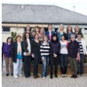
Cewe találkozó 2013. szeptember