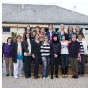
Cewe találkozó 2013. szeptember