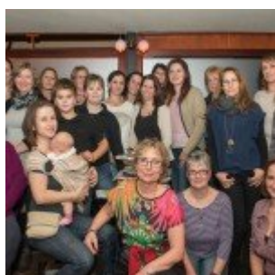
8. CEWE találkozó