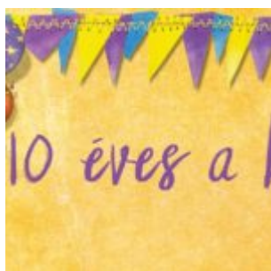
10 éves a blog!