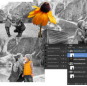
Affinity Photo 1.9