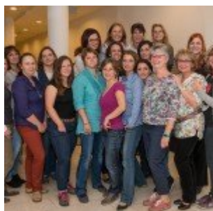
10. CEWE találkozó