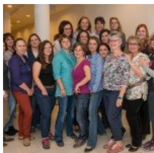
10. CEWE találkozó